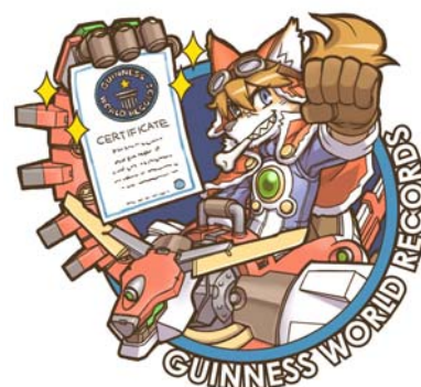
ギネス・ワールド・レコーズ 認定記念イラスト

株式会社バンダイナムコゲームスは 2010 年 10 月 28 日(木)に発売したニンテンドーDS 用ソフト「Solatorobo ソラトロボ それから CODA へ」の CM 放送手法において、「8 時間で異なる 100 通りの同一製品 CM を 100 本流した CM」としてギネス・ワールド・レコード社より認定を受けました。10 月 21 日(木)15 時から 23 時までの 8 時間の間にギネス世界記録に挑戦し、東京メトロポリタンテレビジョンで 100 パターンの CM を放送しました。ゲームに登場するキャラクターの紹介のほか、ゲームの世界観から構想まで多岐にわたる CM の内容が、「驚異的な種類と本数で世界一である」と正式に認められました。