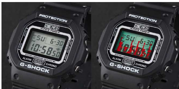
液晶バックライトはアラバスタ編の名シーンを再現しています。

G-SHOCK「麦わらの一味」モデルは“友情のG”をコンセプトに開発しました。時計盤のELバックライトには、ワンピースファンにはなじみの深いアラバスタ編の名シーンを再現。裏蓋には麦わらの一味の2番目の海賊船サウザンド・サニー号の船首を刻印しました。時計バンドには、麦わらの一味全員のシルエットと、サウザンド・サニー号をデザイン。ボディカラーは、男性でも女性でもお洒落に身に付けられるマットなブラックカラーです。