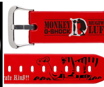
時計バンドには印象に残る名シーンを再現