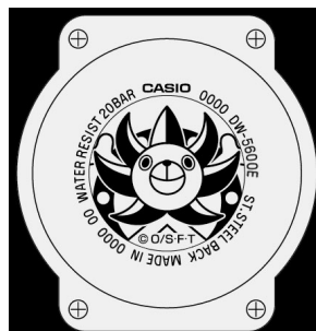
裏蓋はサニー号の船首