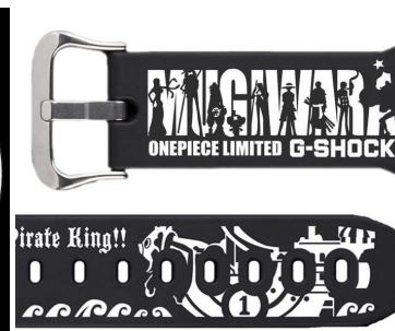
時計バンドには麦わらの一味を再現