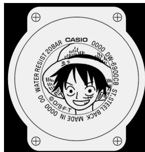
裏蓋はルフィの笑顔